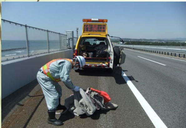
道路の落下物回収

道路を安全に利用できるように、毎日道路のパトロールを行っています。また老朽化や地震、災害などで道路の構造物（橋やトンネルなど）が壊れないように点検や補修・補強工事も行っています。