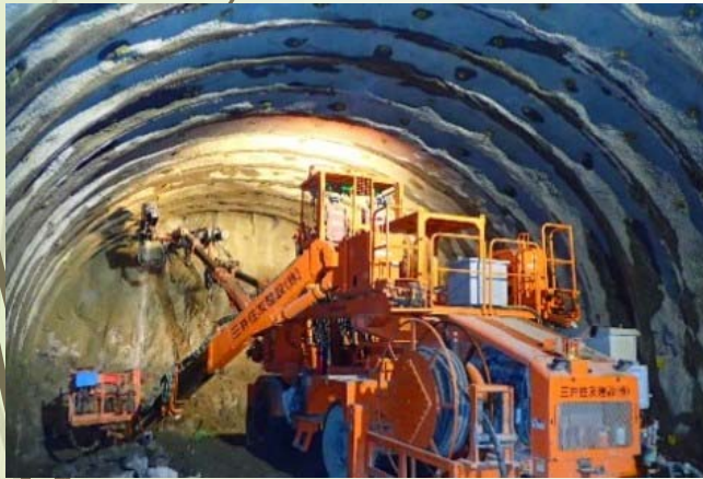
掘削機によるトンネル工事

人の動きや物の流れを活性化させ、経済活動を支えるとともに、災害に強く、安全・安心で快適な道路を作ること、通勤・通学や医療などの日常の生活や暮らしも支えています。