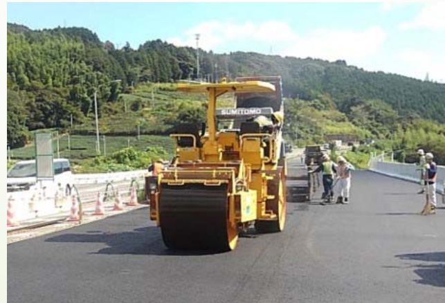
ロードローラーによる道路工事 (舗装)