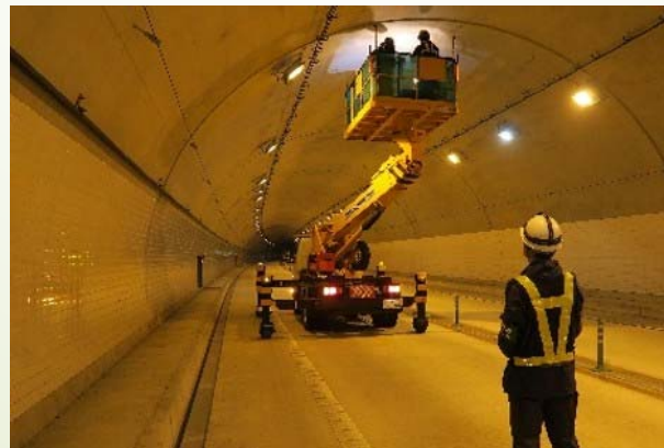
道路のトンネル点検