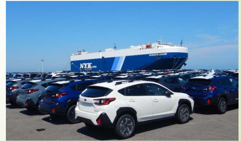
清水港湾事務所 御前崎港 西埠頭岸壁に着岸する自動車運搬船