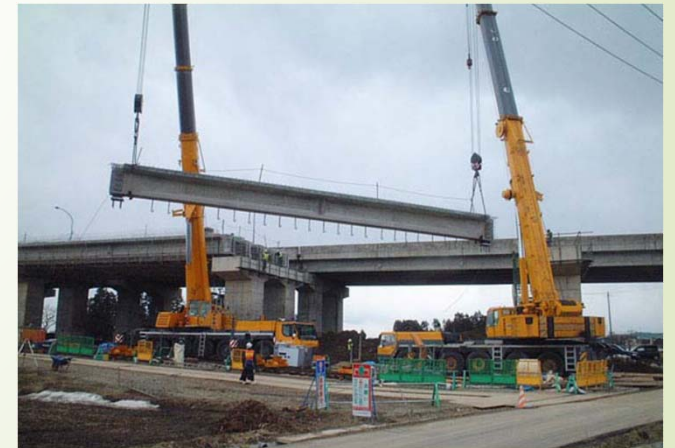
クレーンによる橋梁の架設作業