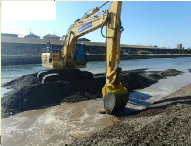
バックホウによる河床掘削 (川の底を削る)

豪雨や台風などによる水害を防ぐために河川を整備する必要があります。河川の氾濫による洪水を防ぐうえで、堤防強化や河川掘削、逆流を防止するために水門の設置等を行います。