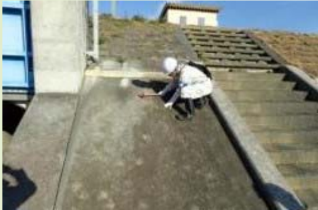
堤防、構造物の点検