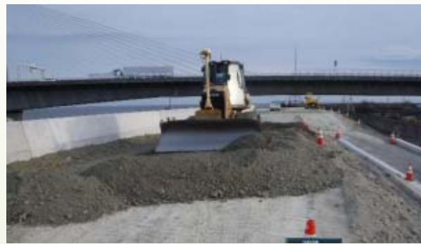
ブルドーザによる堤防の敷き均し (土砂を平らにならす)