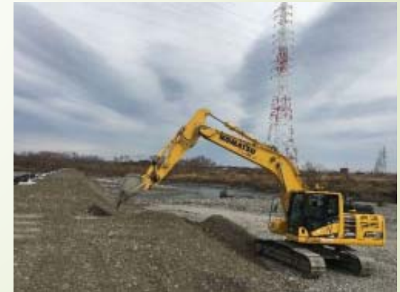
バックホウによる築堤盛土