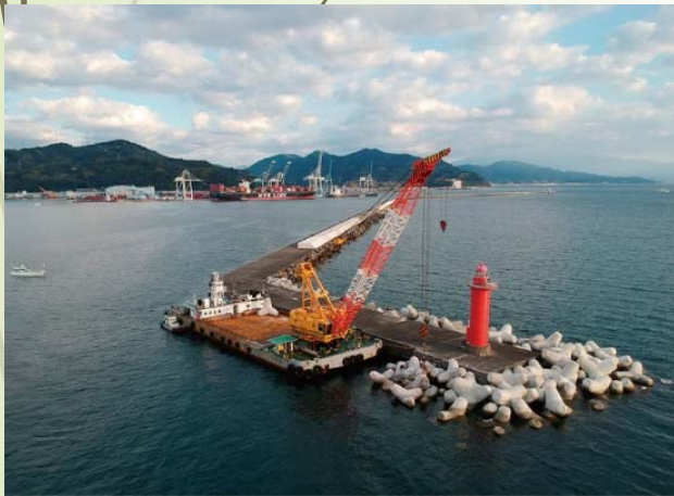
清水港湾事務所 80t型消波ブロックの据付作業

資源・エネルギーや食料、日用品の輸入、自動車をはじめとした世界に誇る日本のものづくり産業が製造した工業製品の輸出入の基盤の役割を担うとともに、津波・高潮・高波から市民生活を守る第一線の防波堤となっています。